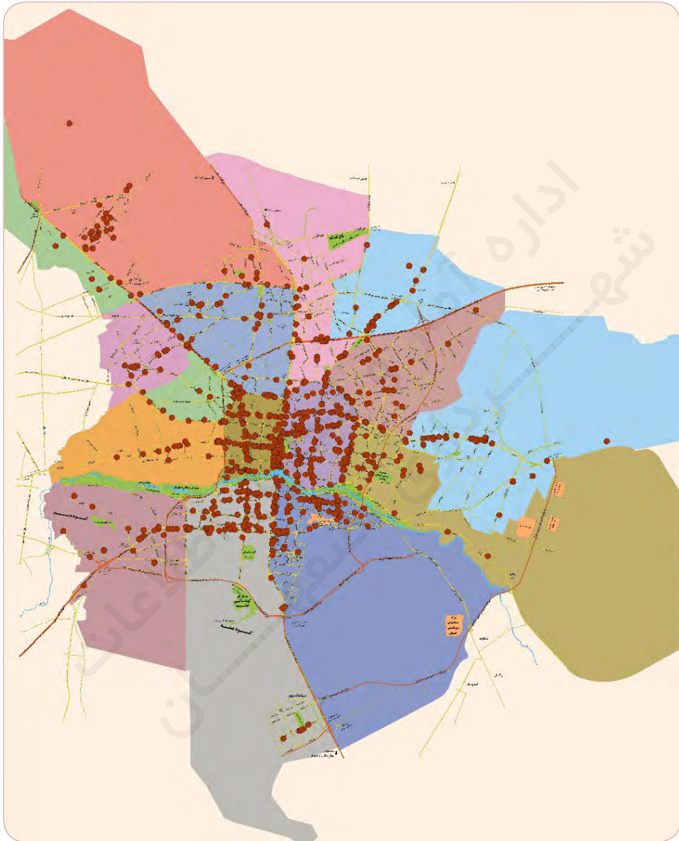
پردازش: اداره آمار و تحلیل اطلاعات شهرداری اصفهان